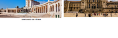
SANTUARIO DE FATIMA

ABRIL 29. - SANTIAGO DE COMPOSTELA. Desayuno. Por la mañana se realizará una visita de la ciudad incluyendo la Plaza del Obradoiro. Posibilidad de asistir a la Santa Misa en la Catedral, considerada como una de las más importantes del mundo. Tarde libre para pasear por esta impresionante ciudad, o bien conocer la Ría Alta y la atractiva ciudad de la Cornua. Regreso al hotel, cena y alojamiento.