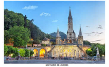
SANTUARIO DE LOURDES

ABRIL 30. SANTIAGO DE COMPOSTELA - COVADONGA - SANTANDER. Desayuno y salida hacia el Principado de Asturias. Se accederá a Covadonga, lugar donde dio comienzo la Reconquista de España. Allí se encuentra el Santuario y la célebre gruta con la imagen de la Virgen. Se proseguirá viaje hacia Santander, atractiva ciudad de verano, con sus maravillosos paseos y playas de arena blanca. Recorrido panorámico y continuación al hotel. Alojamiento y cena.