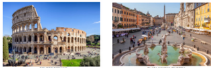
COLOSSEO ROMANO PLAZA NAVONA DE ROMA

¡Es muy importante la Reserva tu cupo...!